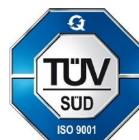
Michael Fernald Head of Central Certification Body Seite 1 bis 2

Dieses Zertifikat ist gültig vom 01. Oktober 2025 bis 30. September 2028 mit dem Neuausgabedatum: nicht zutreffend